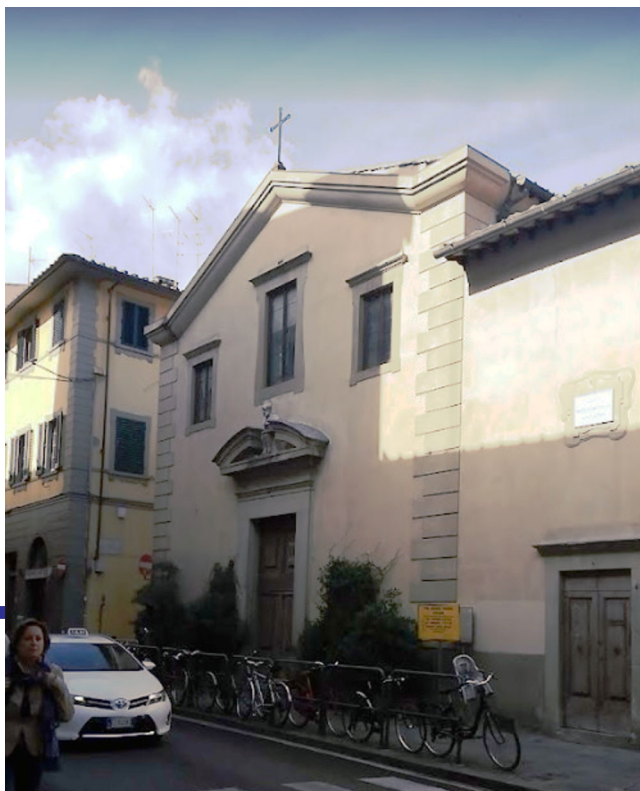
La chiesa di San Pier Gattolino in via Romana a Firenze, da Google maps